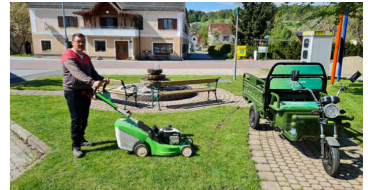
Mirco Schemmerl aus Gersdorf ist heuer mit unserem umweltfreundlichen „Elektro tuk-tuk“ im Gemeindegebiet im Einsatz.

re Gemeinde im Einsatz und kümmert sich um die Pflege der Außenanlagen. Zu seinen Aufgaben gehören die Mäh- und Pflegearbeiten der öffentlichen Anlagen im Gemeindegebiet (Sportplatz, Freibad, Kindergarten und sonstige öffentliche Flächen), sowie das Ausmähen der Verkehrszeichen an unseren Gemeindestraßen.