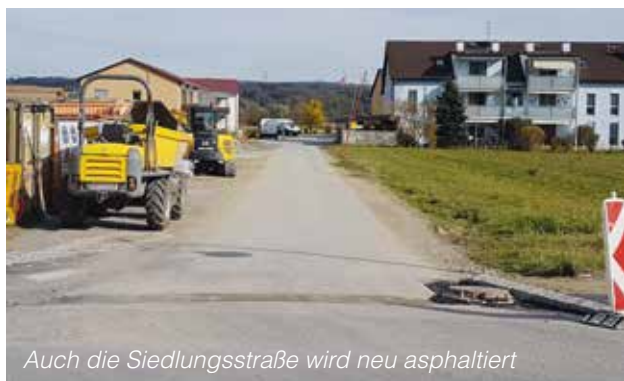
Auch die Siedlungsstraße wird neu asphaltiert